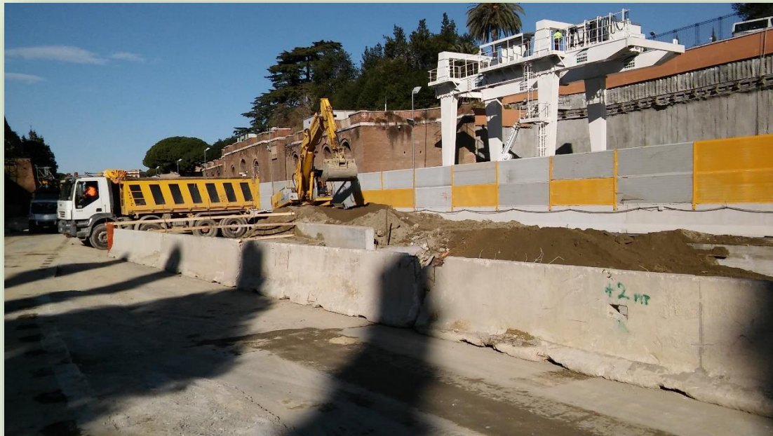
CANTIERE STAZIONE FORI IMPERIALI