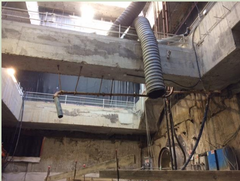
CANTIERE POZZO 3.3 (GIARDINI DI VIA SANNIO)