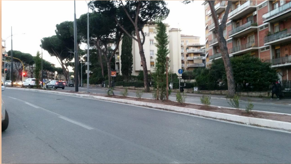
CORRIDOIO LAURENTINA PIANTUMAZIONI VERDE