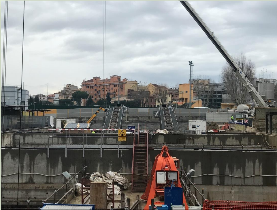
CANTIERE STAZIONE AMBA ARADAM