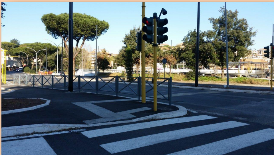
CORRIDOIO LAURENTINA PIAZZALE DOUHET