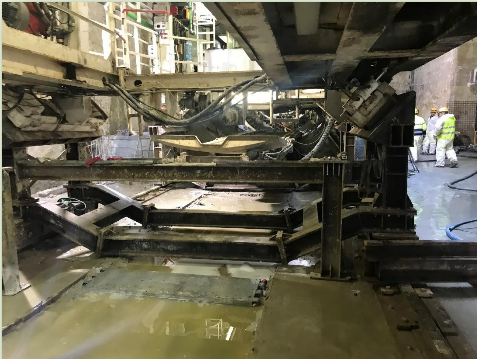
CANTIERE STAZIONE AMBA ARADAM