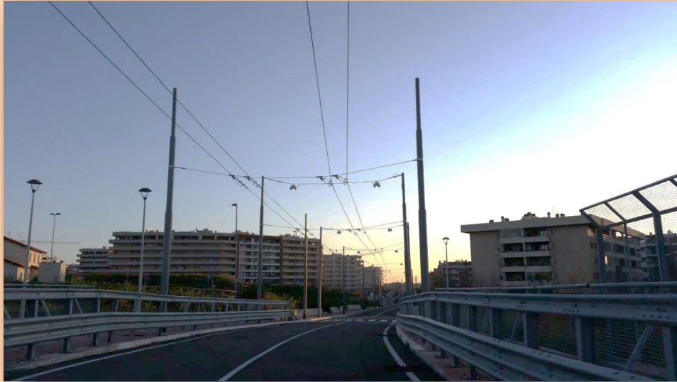
CORRIDOIO LAURENTINA RETE AEREA