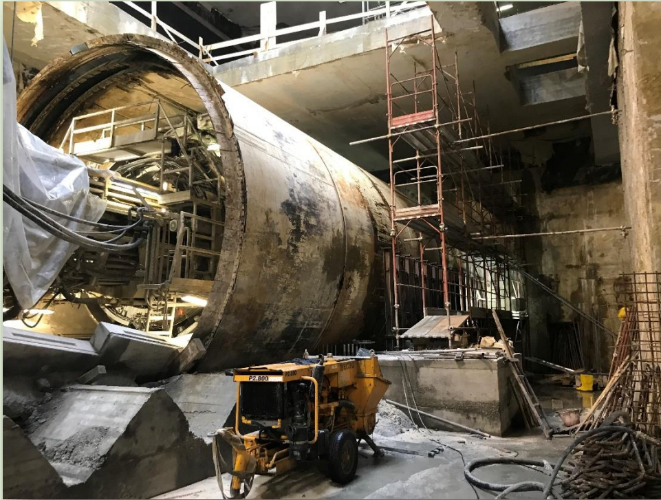
CANTIERE STAZIONE AMBA ARADAM