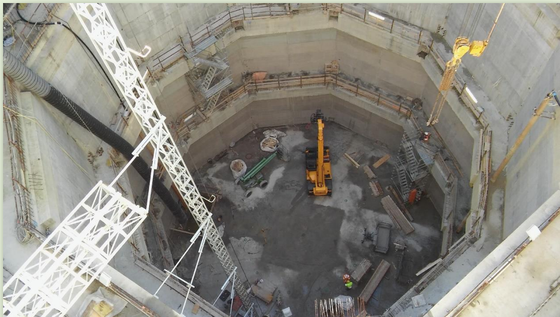
CANTIERE POZZO 3.2 CELIMONTANA