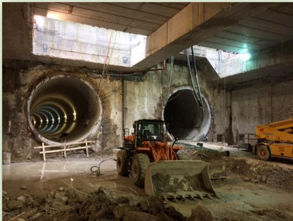
CANTIERE POZZO 3.3 (GIARDINI DI VIA SANNIO)