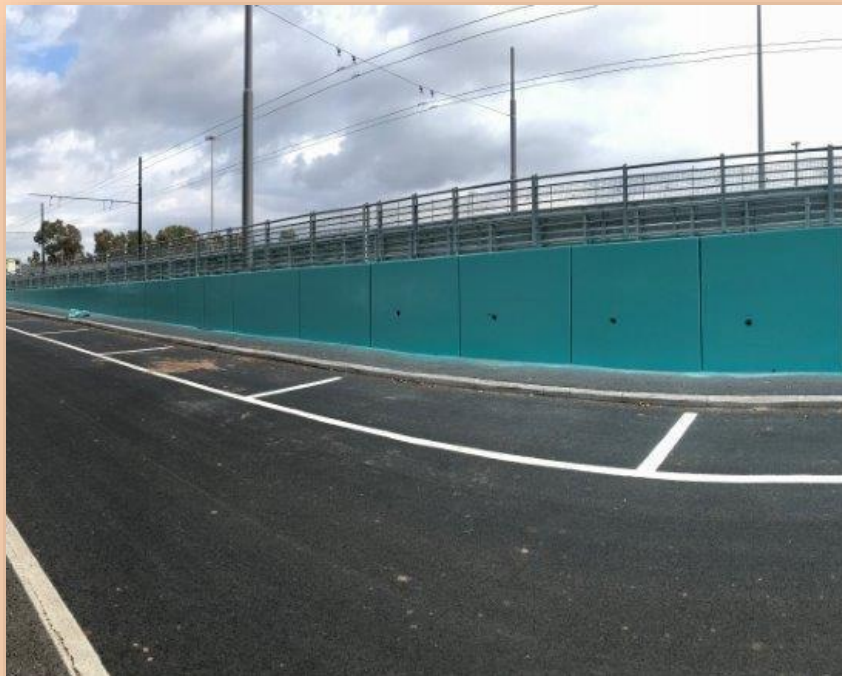
RAMPA APPROCCIO VIADOTTO GRA