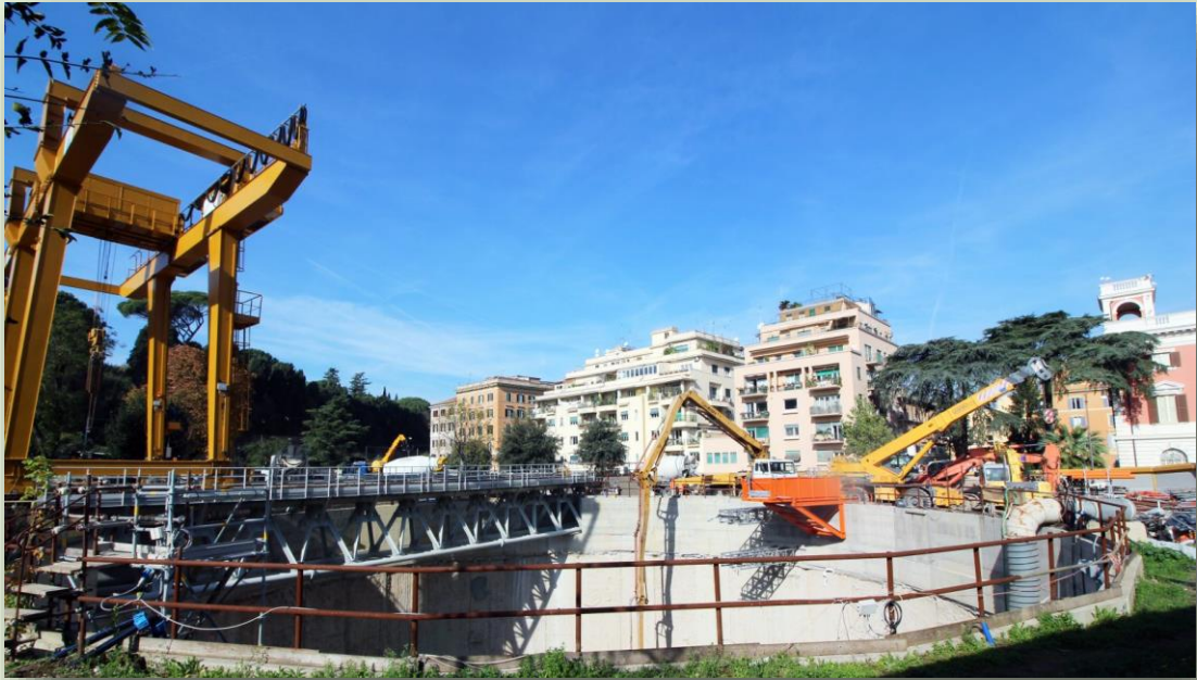
CANTIERE POZZO 3.2 CELIMONTANA