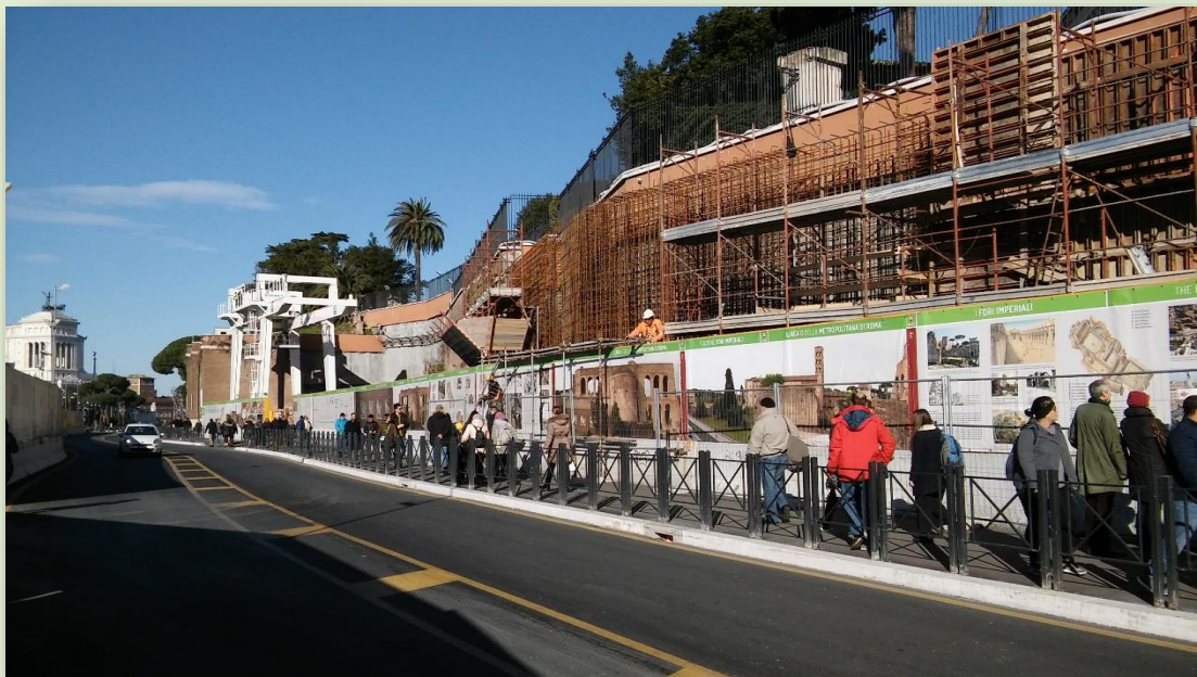
CANTIERE STAZIONE FORI IMPERIALI