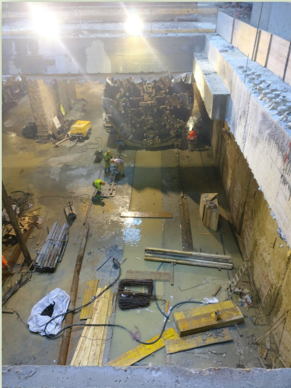
CANTIERE STAZIONE AMBA ARADAM